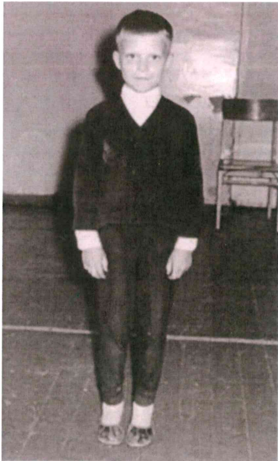
Mine vanaisa esimeses klassis