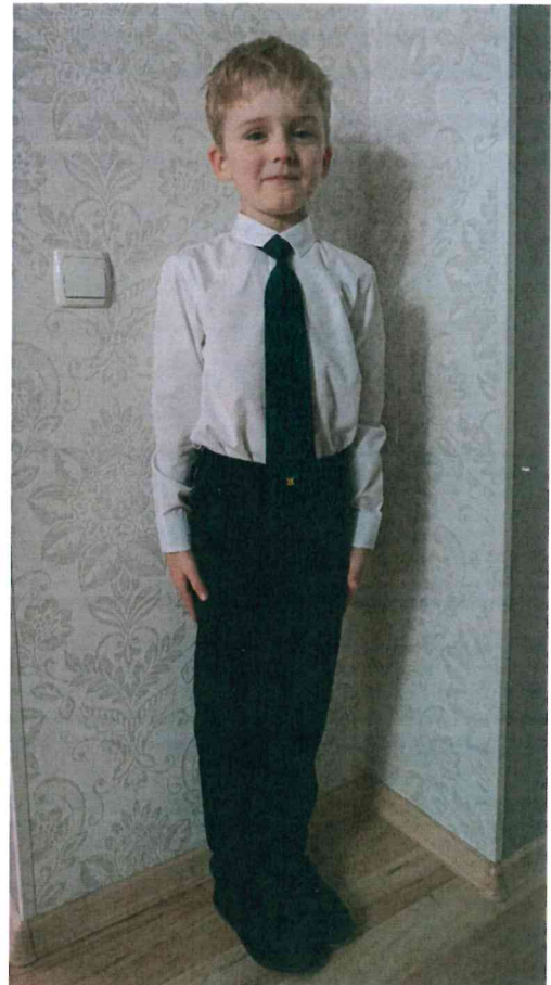
Mina esimesel koolipäeval