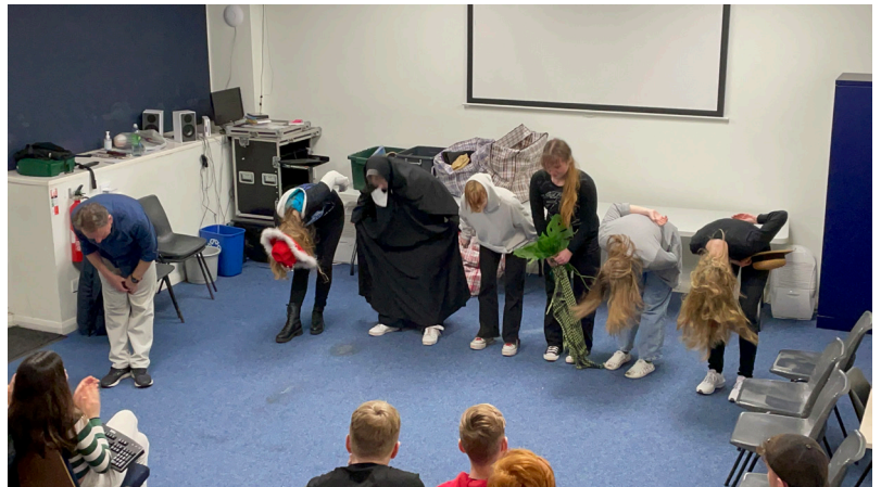
All the world's a stage. W. Shakespeare