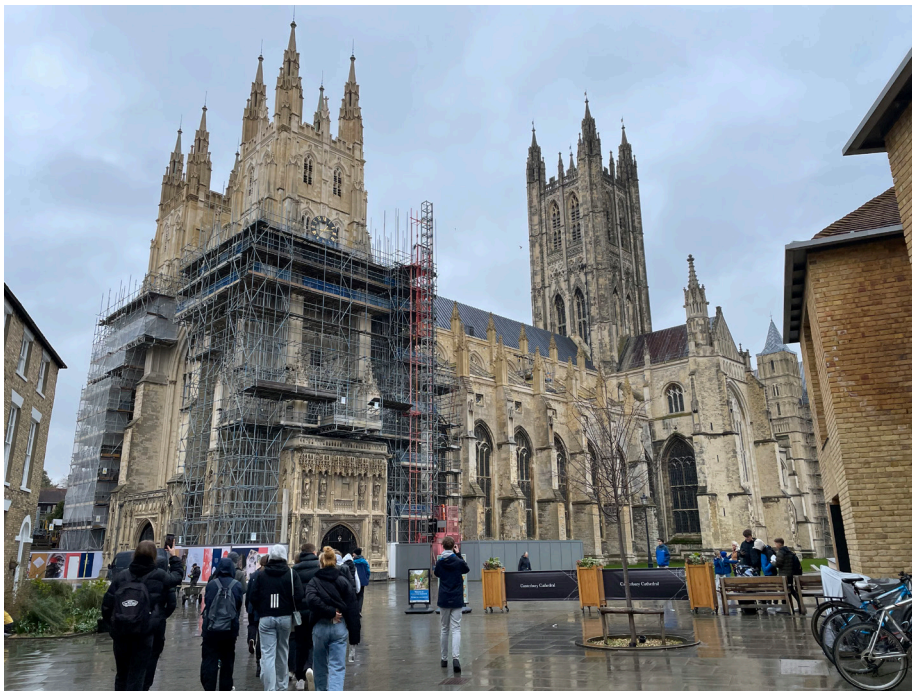
Majesteetlik Canterbury katedraal – anglikaani kiriku peapiiskop käib seal tööl. Normannid hakkasid seda ehitama juba 1400 aasta eest ...