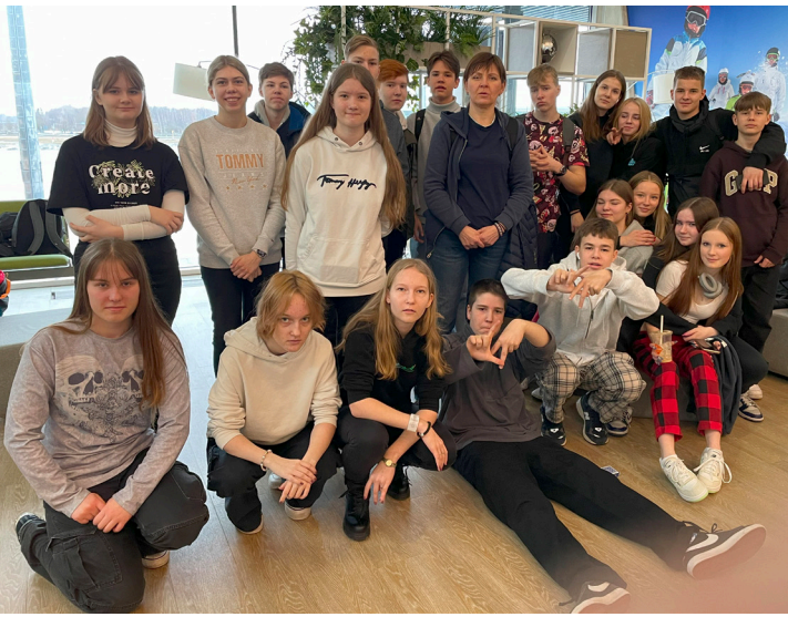
Broadstairs here we come! 8.c lennujaamas 19. märtsi hommikul.