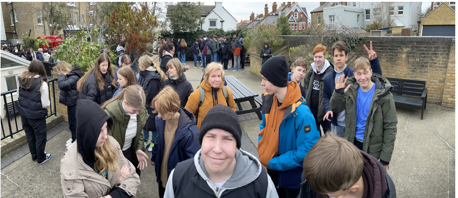
Vahetund Kent School of English hoovis.