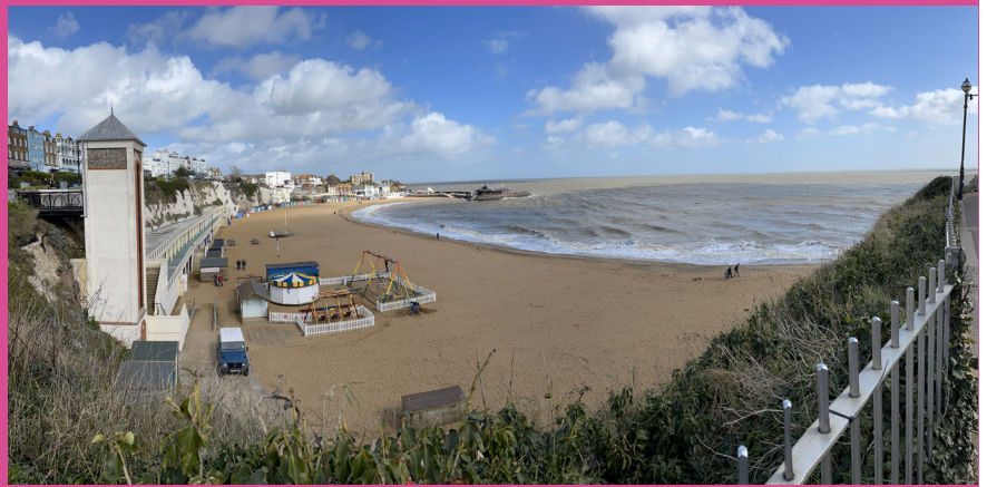
Viking Bay, Broadstairs – tõus