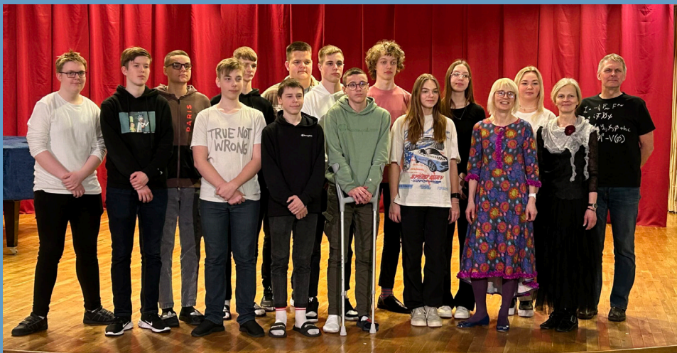
Väike-Maarja õpilased ja õpetajad meie kooli laval.