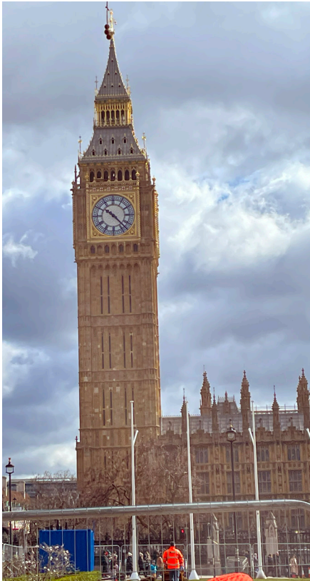
Ben, Big Ben. London, England, UK.