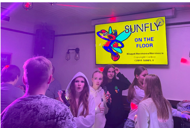
Karaoke night. Laulavad tüdrukud.