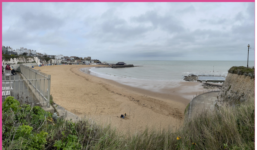
Viking Bay, Broadstairs – mõõn