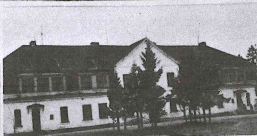
Loksa Keskkool 1967